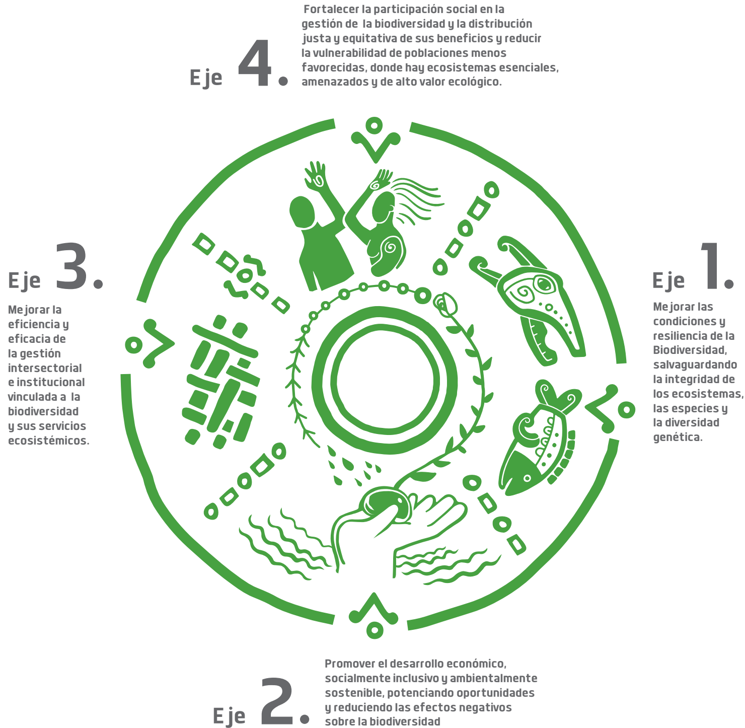
Ejes de Política Nacional de Biodiversidad